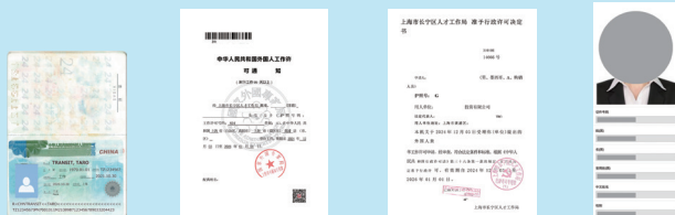
居留許可 外国人工作許可通知 行政許可決定書 就業信息表